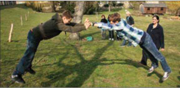
Vertrauen auf dem Drahtseil