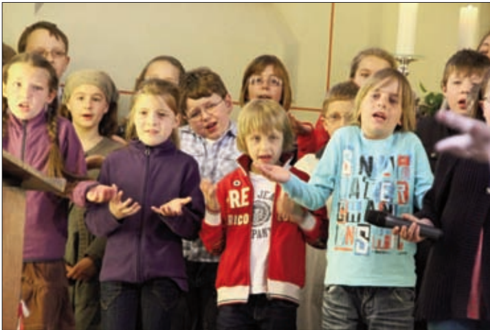
Musicalaufführung am 1. Mai 2011

Am Sonntag, dem 1. Mai, konnte man sich dann von der Spielfreude und der Begeisterung der Kinder in der halbstündigen Aufführung des Singspiels „Eins, zwei, drei – Gott gewinnt anders“ und der Gestaltung des Gottesdienstes überzeugen. Ein großer Dank gilt allen Kindern, die