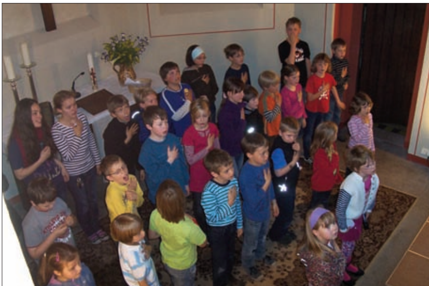
Probe bei den Kinderkirchspieltagen

war mit Eifer bei der Sache und sorgte auch im Hintergrund für einen reibungslosen Ablauf. So wurden die Aufführung und die Kinderkirchspieltage ein voller Erfolg, lang anhaltender Beifall und strahlende Kinderaugen erzählten davon.